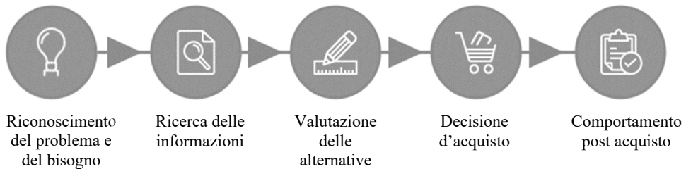
Figura 1.2. – Le cinque fasi del processo decisionale d'acquisto di Dewey

ficare le fasi del processo d'acquisto tramite un modello a stadi che viene tutt'ora utilizzato nel filone accademico del consumer behaviour e rimane per i ricercatori di marketing ancora un buon metodo per valutare il processo decisionale (Kotler, 1978; Cox et al. , 1983; Assael, 1998; Cooney et al. , 2001; Blackwell et al. , 2005; Darley et al. , 2010; Kotler, Armstrong, 2010).